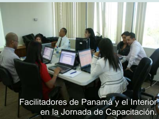
Facilitadores de Panamá y el Interior en la Jornada de Capacitación.

Del 18 al 22 de enero se realizó, en las oficinas de la DGCP, una jornada de capacitación y de intercambio de ideas entre los facilitadores de nuestra institución.